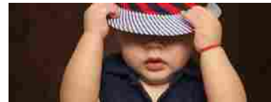
Assegno Unico 2022: dai documenti al simulatore, tutto ciò che devi sapere