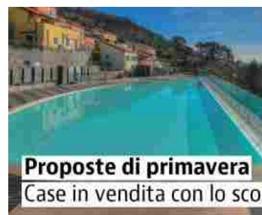
Ranking: Case d'occasione