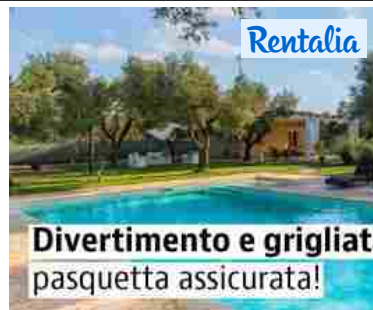
Case vacanze: Last minute per Pasqua e Pasquetta in una casa con barbecue