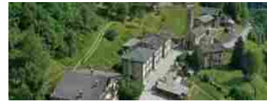
Un viaggio a Coumboscuro, il piccolo paesino in Piemonte dove la lingua madre non è l'italiano

Il consiglio, specifica Pezzetta, vale sia per gli utenti che per i portali che ospitano gli annunci. “Sarebbe auspicabile che i portali accettassero solo annunci che provengono da persone con credenziali valide, in modo da scoraggiare chi abbia intenzione di pubblicare annunci civetta”, osserva Pezzetta.