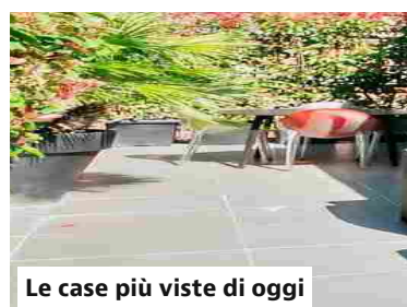
Le case più viste di oggi